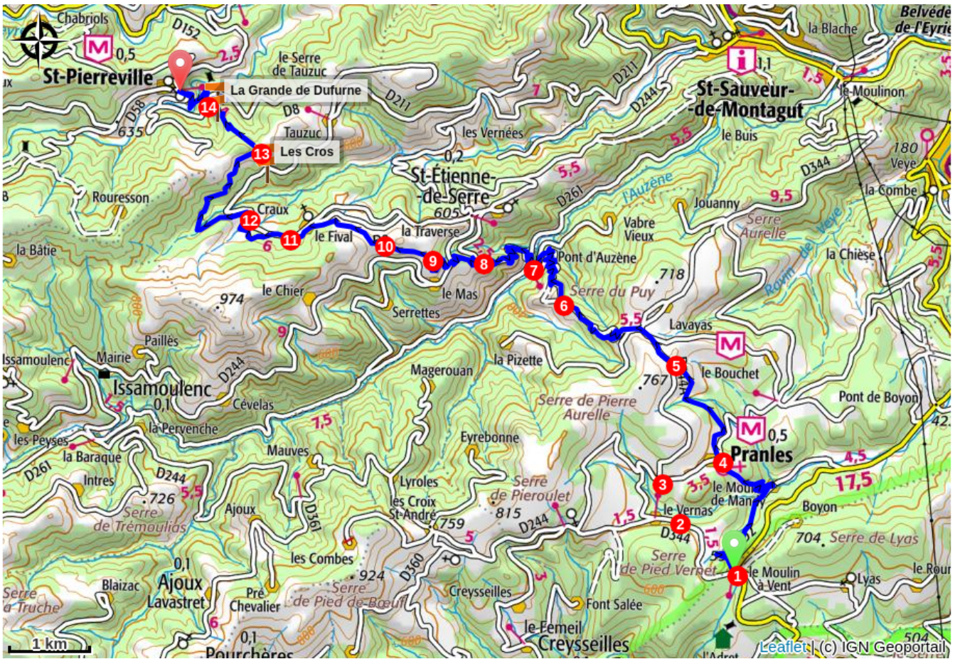
Environmental sensitive areas