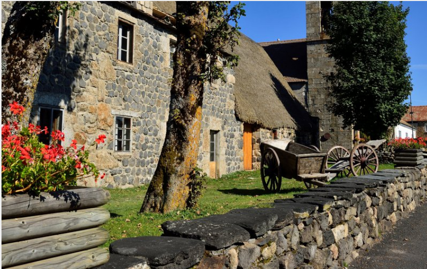
Ferme de Clastres et église