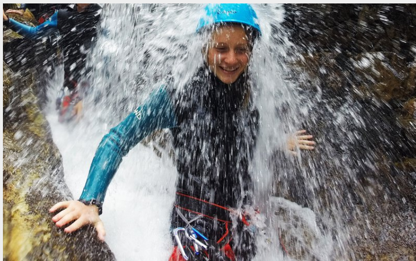
Crédit photo : Cascade canyoning Ardèche sur la Borne (Nature Canyon)