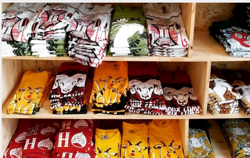
Le Myrtillier - intérieur boutique tshirts