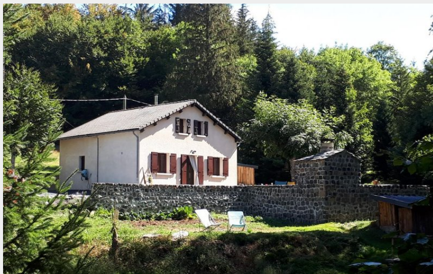
maison en pleine nature et bien ensoleillée