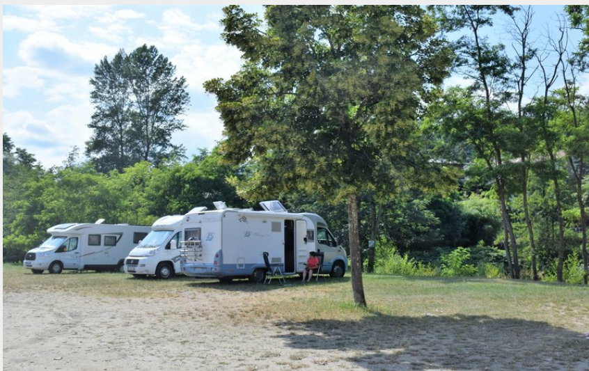
Aire de camping-car