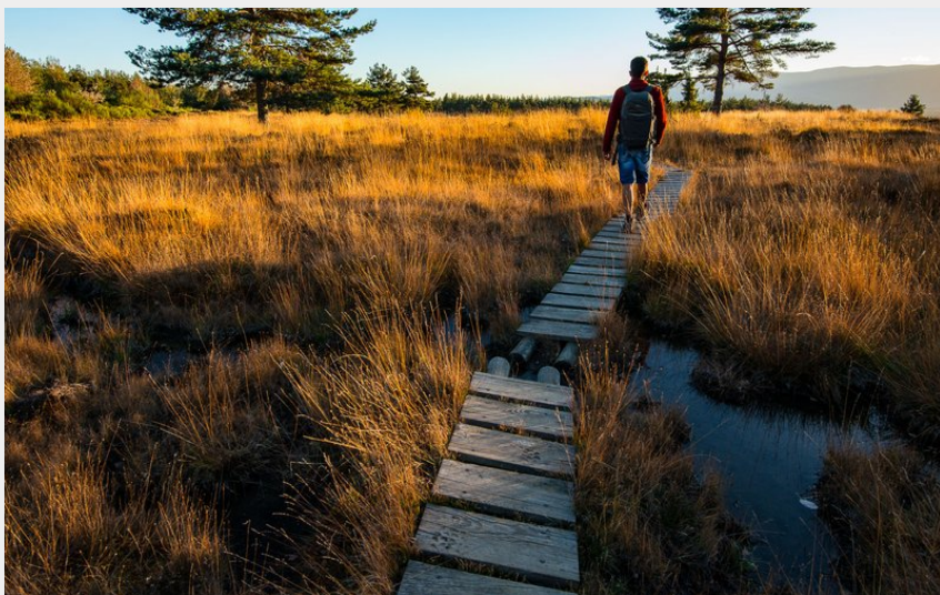
Les Tourbières des Narcettes