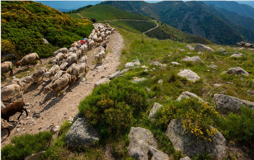
Transhumance sur le Tanargue