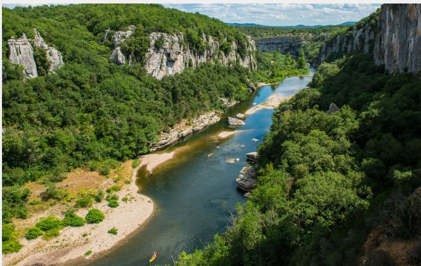
Gorges du Chassezac