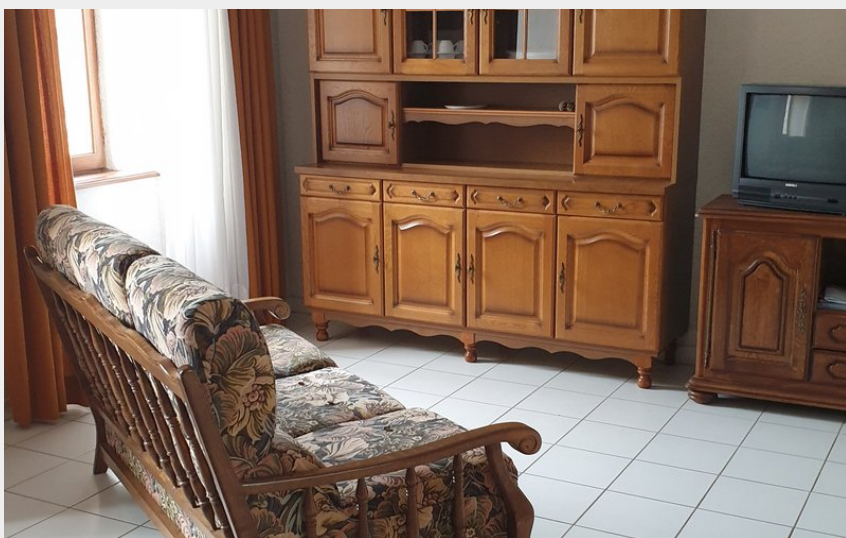
Crédit photo : Gîte Myrtille - séjour (Mairie Saint-Jeure d'Andaure)