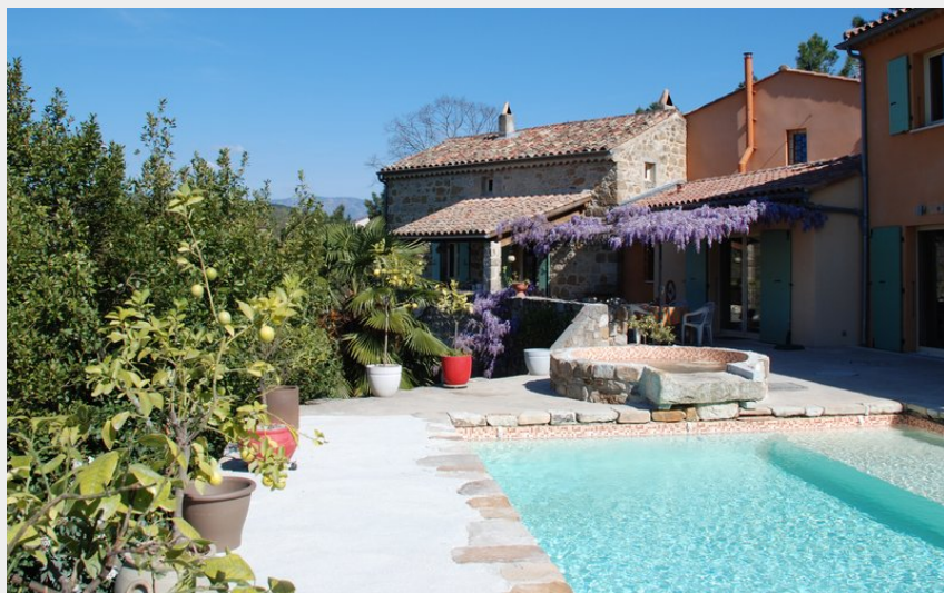
Crédit photo : Chambres d'hôte au Creux du Chambon joyeuse ardeche (v_chambon)