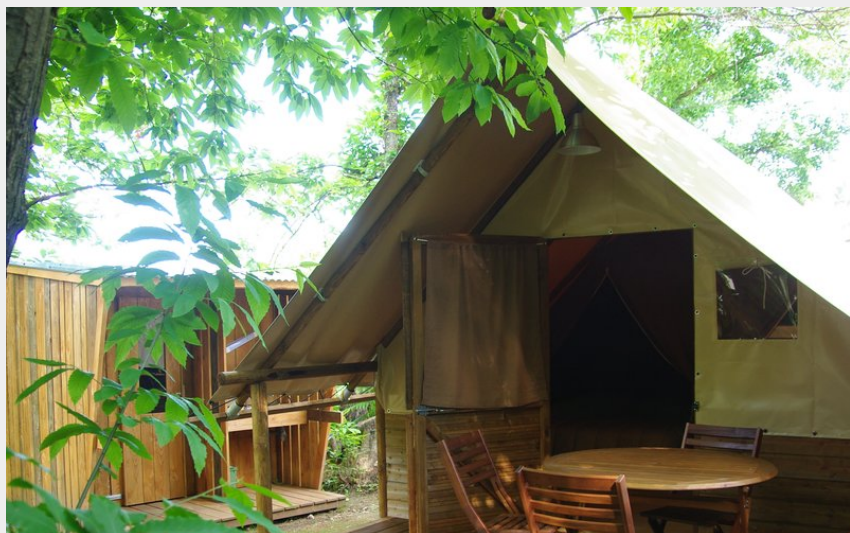
Crédit photo : Terrasse et cabane sanitaire (Camping La Châtaigneraie)