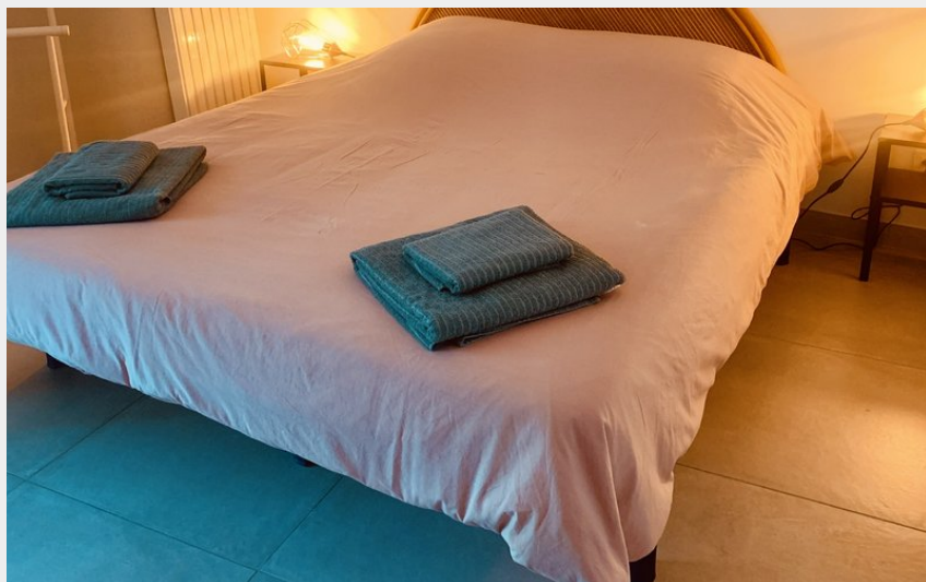
Crédit photo : chambre double auberge du thélème (auberge du thélème)