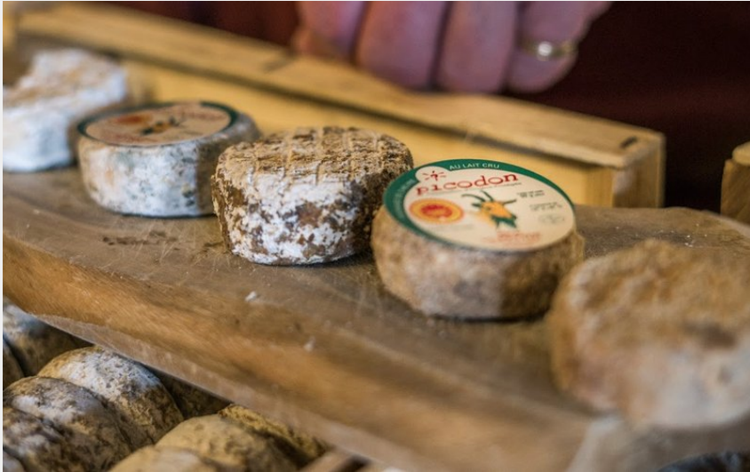
Crédit photo : Terra Cabra - Peytot, Ferme et atelier d'affinage (Borre Zimmermann)