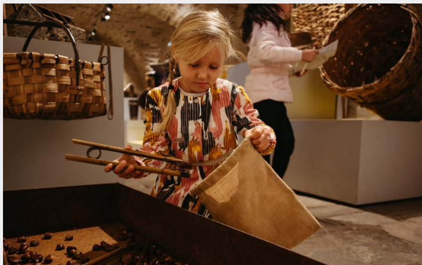
Crédit photo : Jeu du ramassage de châtaignes (Raphael_Pellet_CevennesD_ardèche)