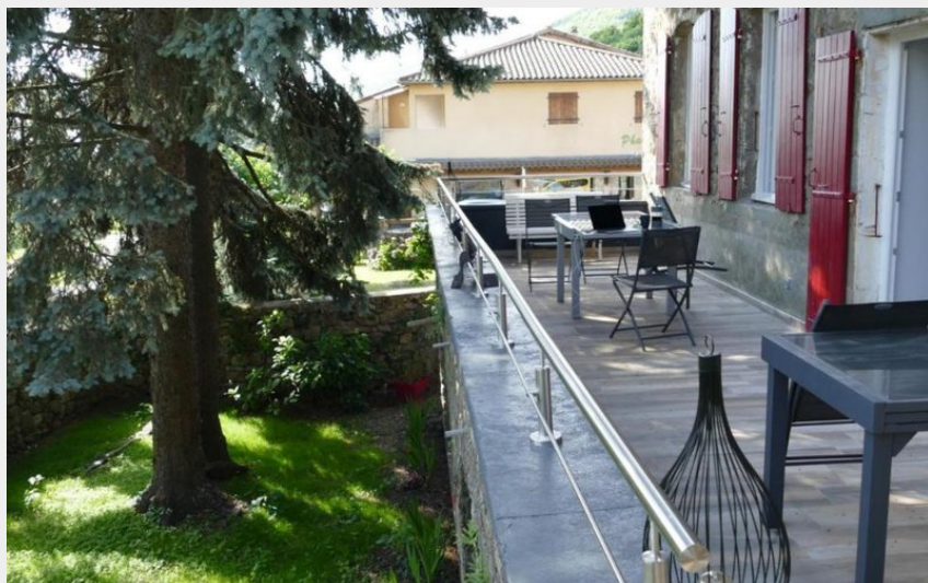
Montpezat sous Bauzon - Au pied de la béalière