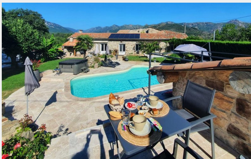
Petit déjeuner en surplombant la piscine