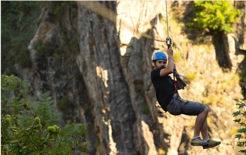
Thueyts - Via ferrata du Pont du Diable 3