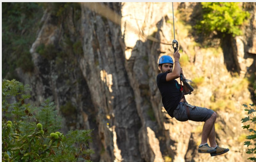
Thueyts - Via ferrata du Pont du Diable 3