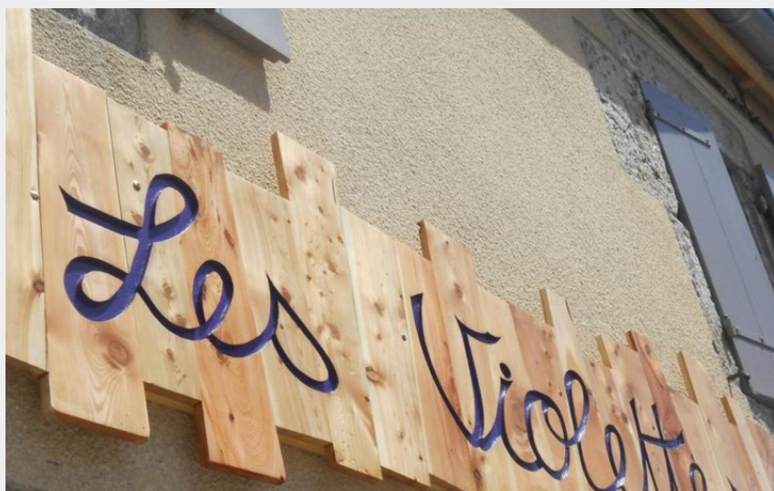
Panneau Entrée Les Violettes Sainte Eulalie