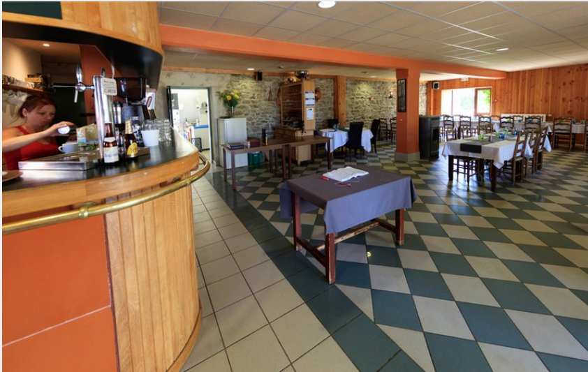
Bistrot de Pays "Auberge du Bez"