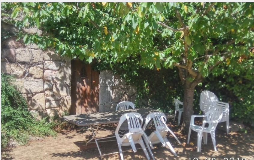
table extérieur a l'ombre du cerisier