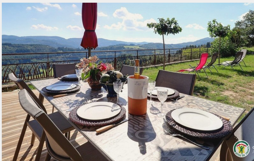
Crédit photo : La Petite maison avec jardin et vue magnifique (Gîtes de France)