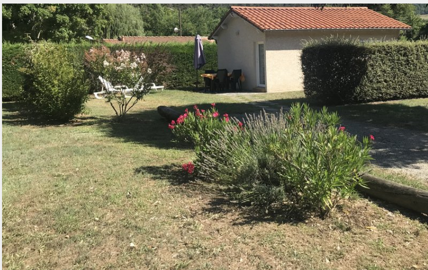
Votre petite maison de vacances "La Désirée"