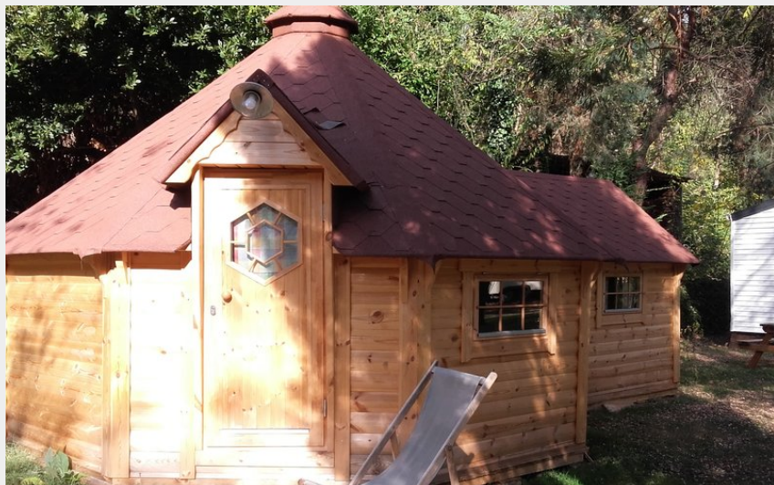
Crédit photo : Kota finlandais, avec sanitaires, 4 personnes (Camping le Viaduc Ardèche)