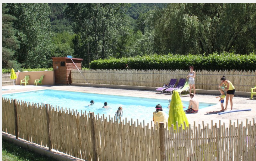
Crédit photo : Piscine du Camping les Berges du Doux (Camping les Berges du Doux)