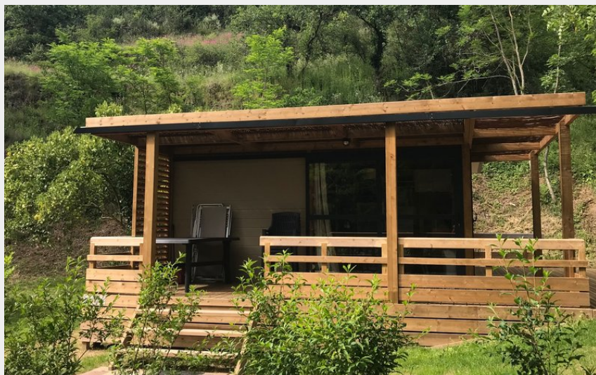
Crédit photo : Chalet panoramique _camping les berges du doux (Camping Les berges du Doux)