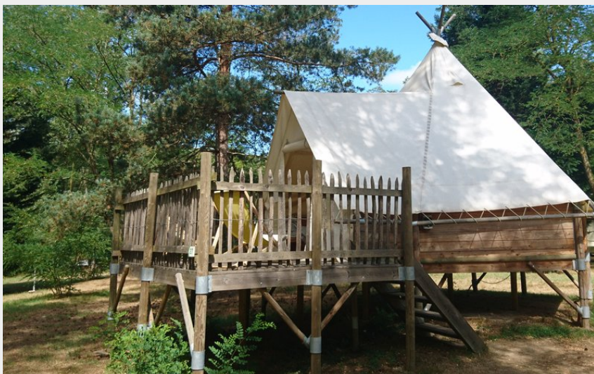
Crédit photo : Tipi-lodge, Camping Le Viaduc (Camping Le Viaduc Ardèche)