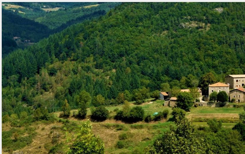
Le serre de Sardier