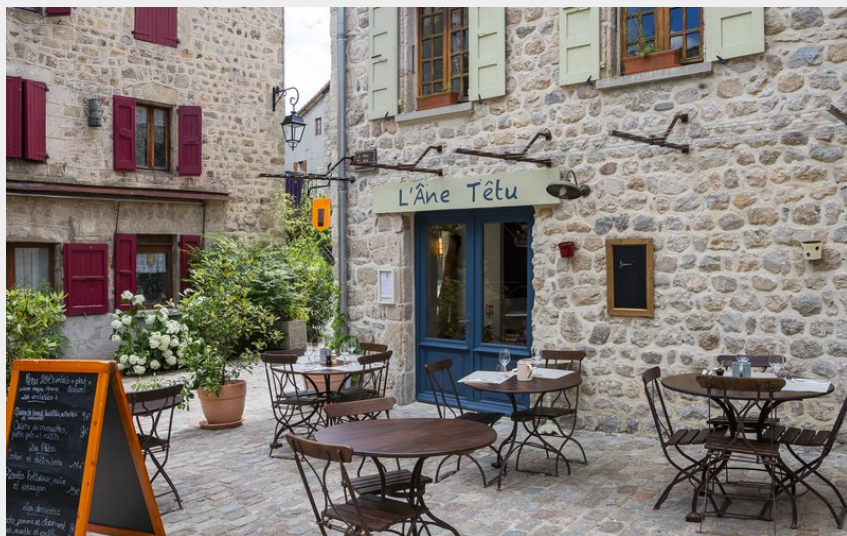
Crédit photo : La terrasse sur la place de la Fontaine (L'Âne Têtu)