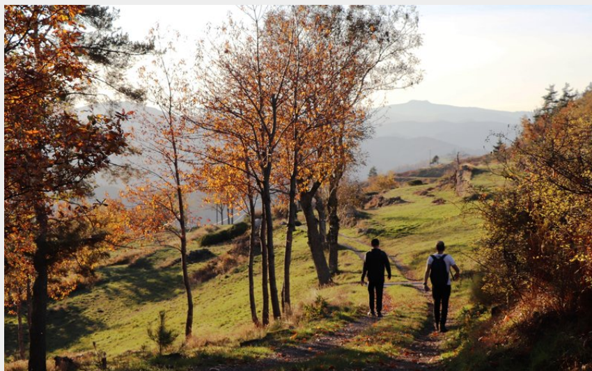
Un chemin de randonnée à proximité du gîte