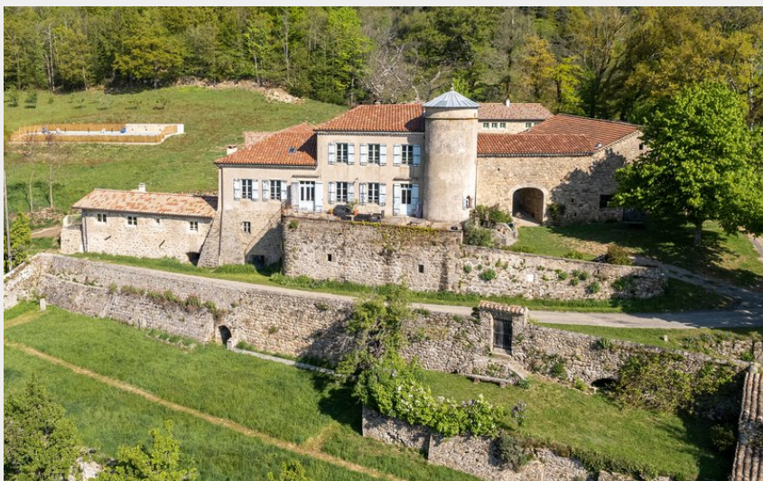
Le Domaine de Fontréal vu du ciel