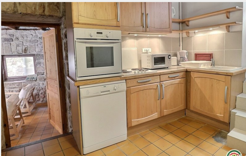
Crédit photo : Séjour Cuisine authentique et équipée (Gîtes de France)