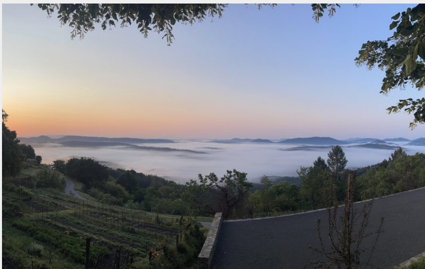
La vue de notre terrasse au Bistrot de Malbosc