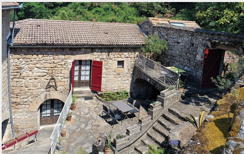
Tilleul Gravières