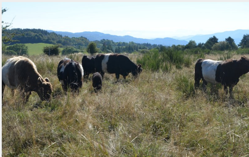
Crédit photo : Petit troupeau de vaches Galloway (Ferme du Grand Freydier)