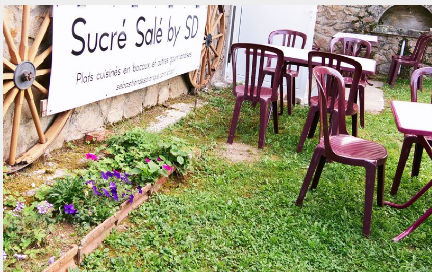
Extérieur (terrasse si météo adaptée)