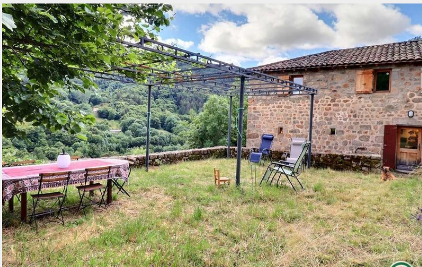
Crédit photo : Maison Léonard avec une vue magnifique (Gîtes de France)