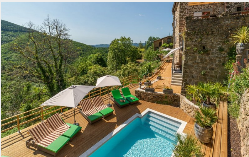
Chambre d'hôte la Calade - vue générale piscine