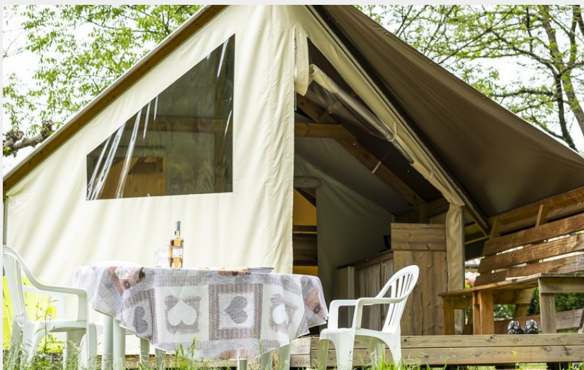
Crédit photo : Tente Lodge Trek Duo, Insolite au Camping La Turelure en Sud Ardèche