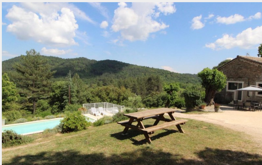
Crédit photo : Le Moulin de Chabert avec piscine à partager (Gîtes de France)