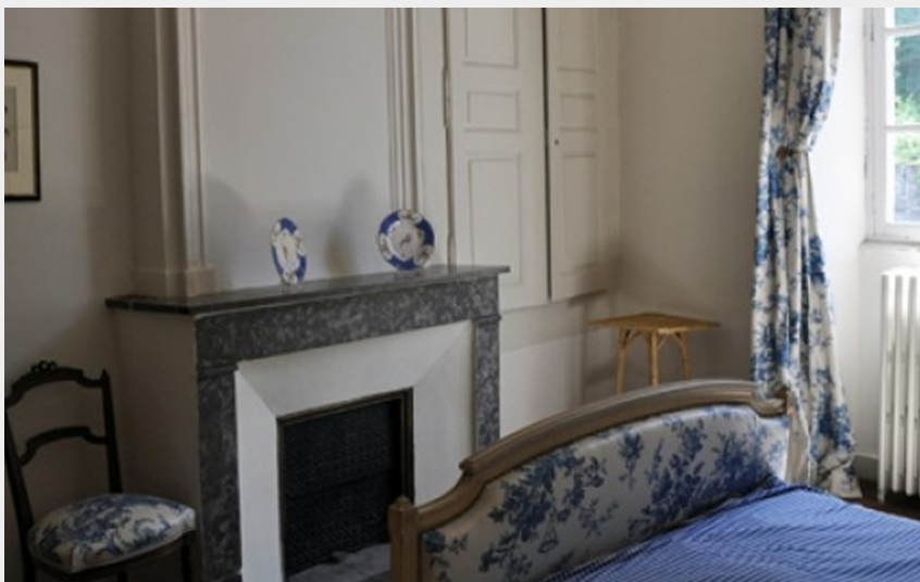
Crédit photo : Chambre anglaise à Largentière (Sud Ardèche) (Saadi)