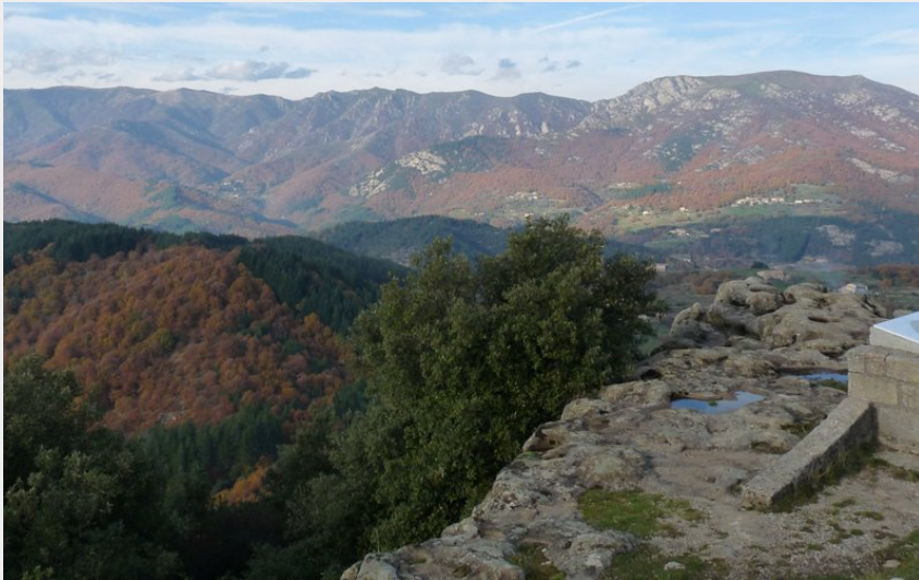
Panorama depuis le belvédère de la Tour de Brison