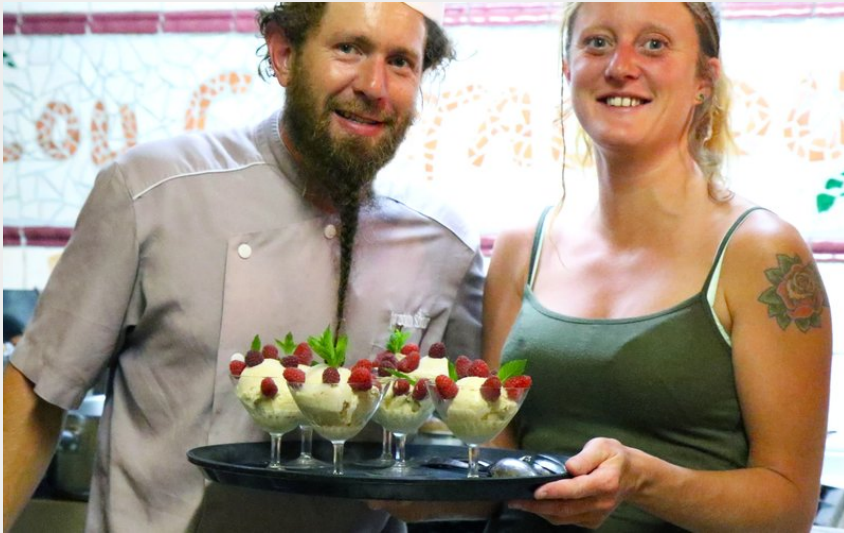
Auberge Lou Castagnou à Chazeaux (Ardèche)