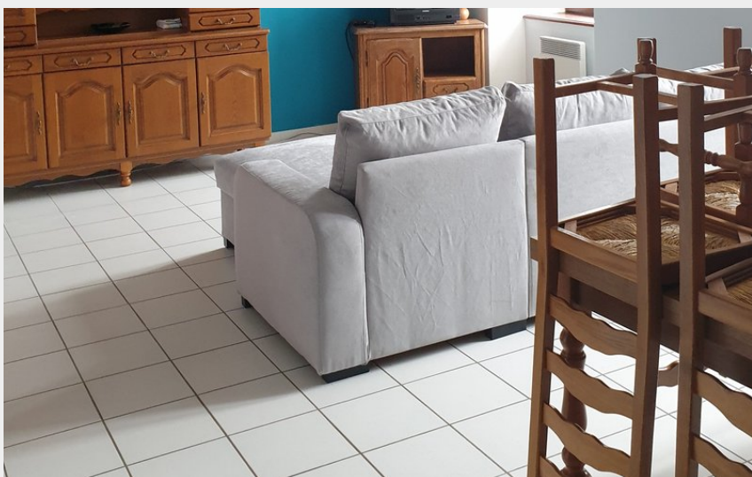
Crédit photo : Gîte châtaigne - séjour (Mairie Saint-Jeure d'Andaure)