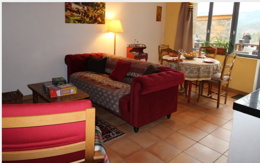
Pièce de vie donnant sur la terrasse