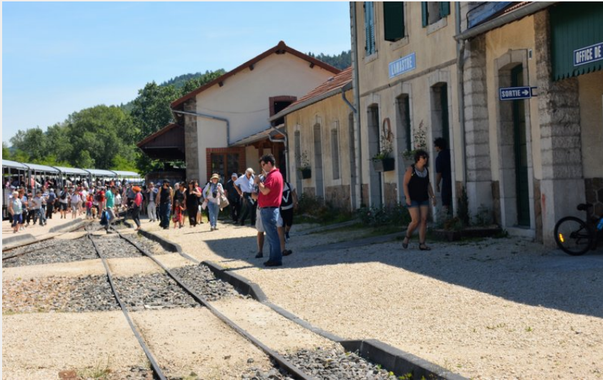
Crédit photo : Gare d'arrivée du Mastrou (Office de Tourisme du Pays de Lamastre)