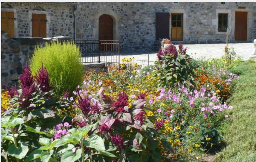
Crédit photo : L'entrée du moulin (© Association Le Meunier de Mandy)