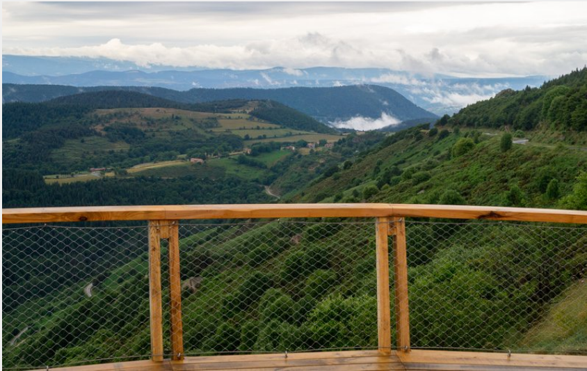
Belvédère Col de Meyrand