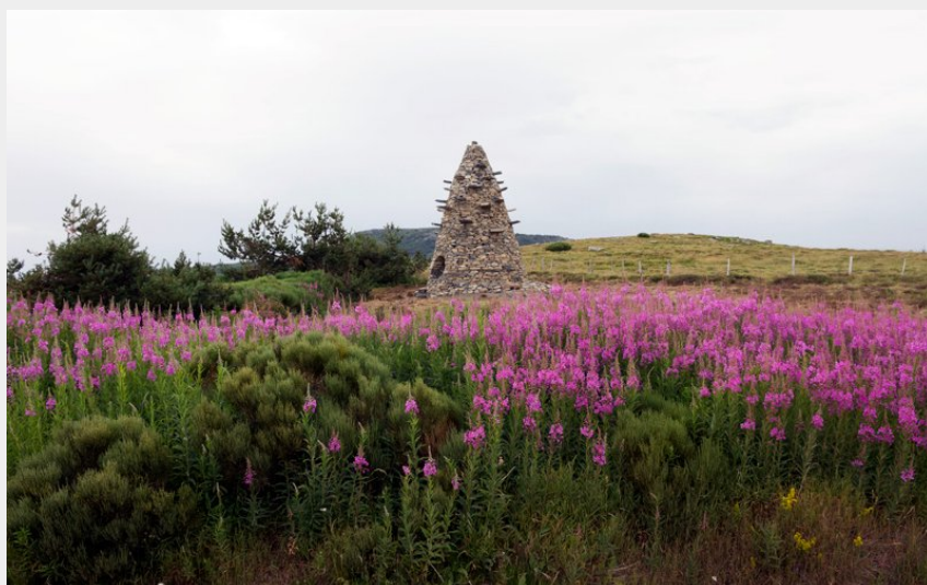
Crédit photo : La Tour à Eau de Gilles Clément (PNR Monts d'Ardèche)